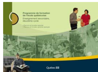
2e cycle secondaire