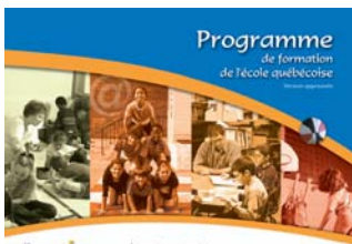
Préscolaire et primaire