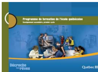
1er cycle secondaire